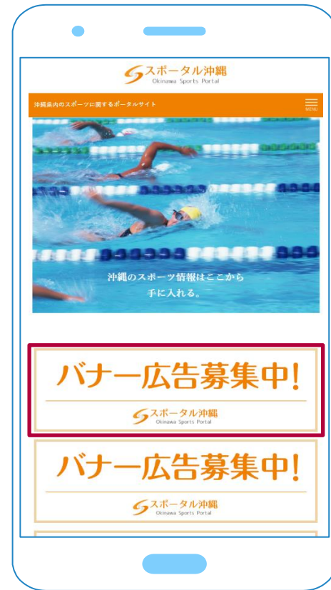
スマホでの掲載箇所