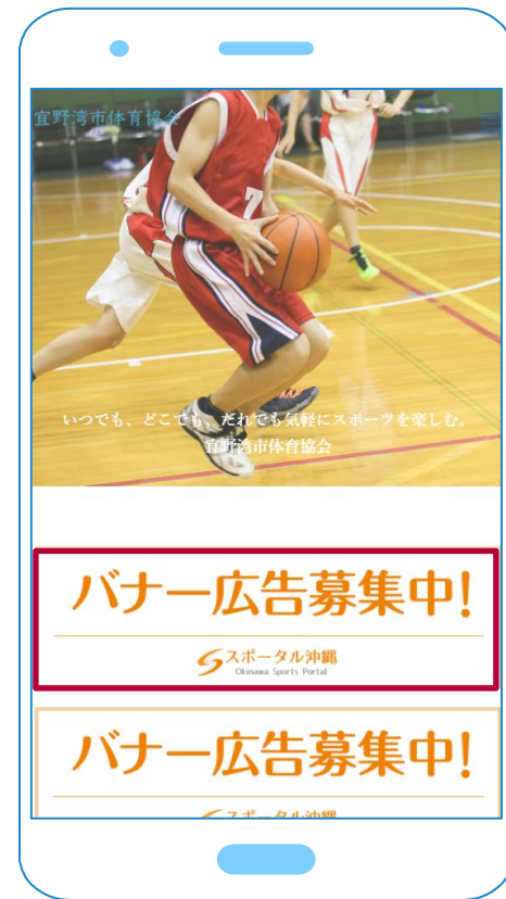
スマホでの掲載箇所