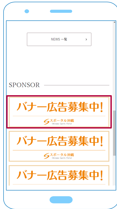
スマホでの掲載箇所