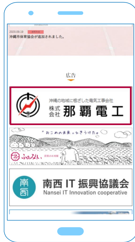
スマホでの掲載箇所