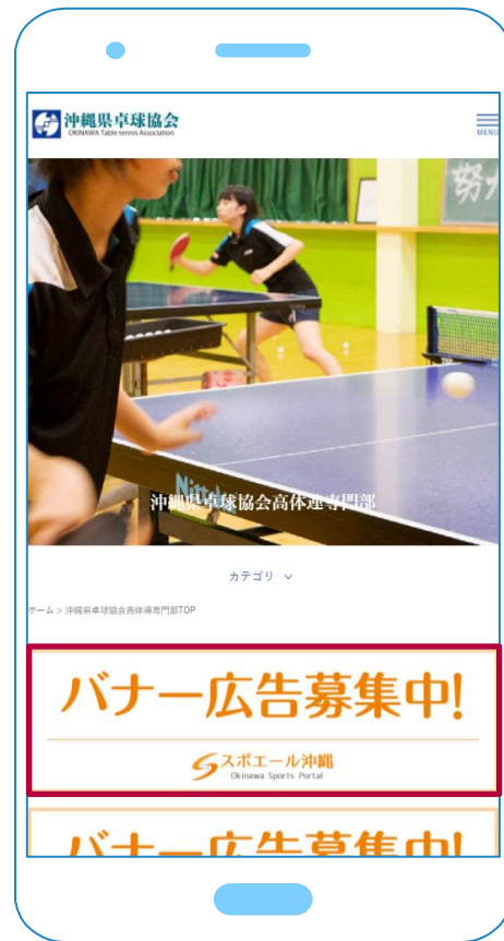
スマホでの掲載箇所