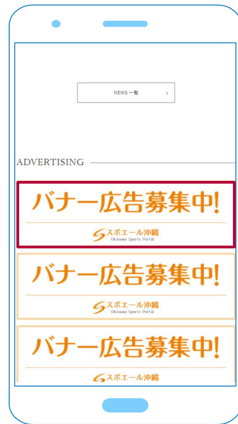
スマホでの掲載箇所