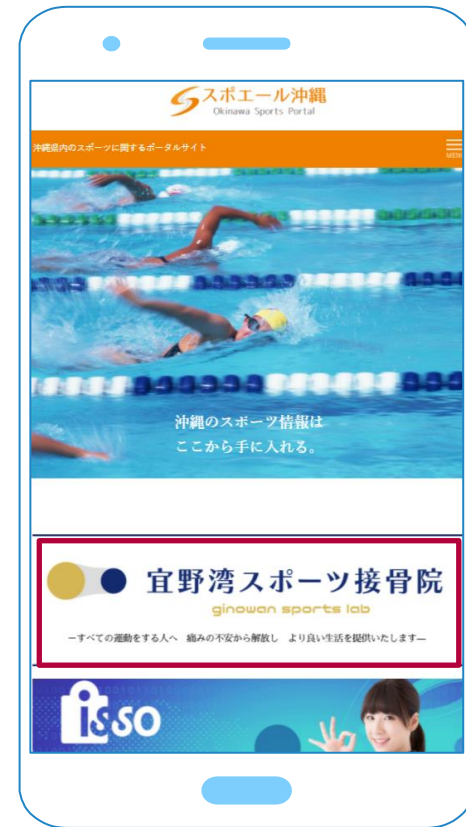
スマホでの掲載箇所