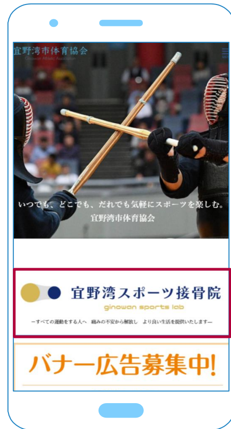
スマホでの掲載箇所